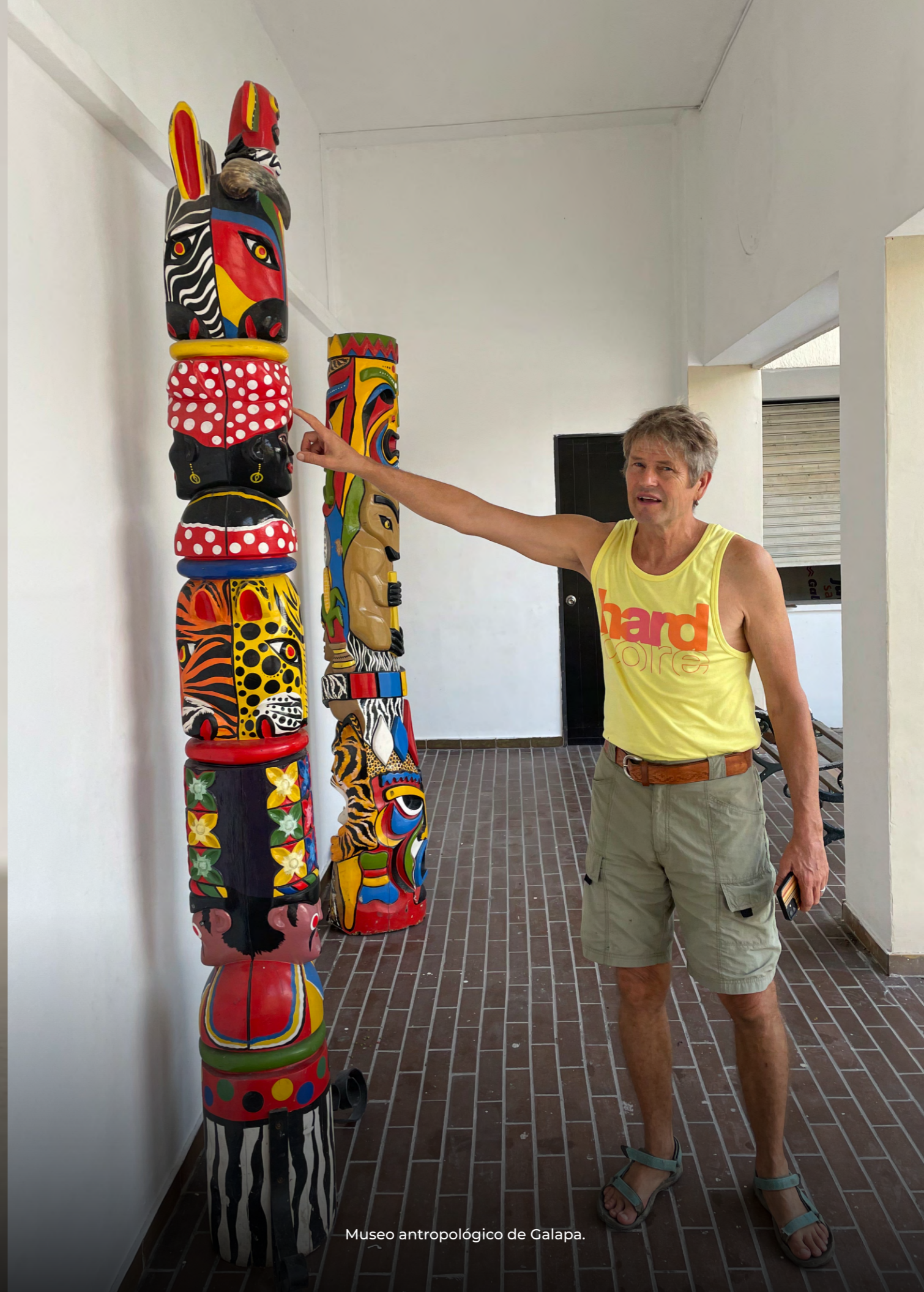
Museo antropológico de Galapa.