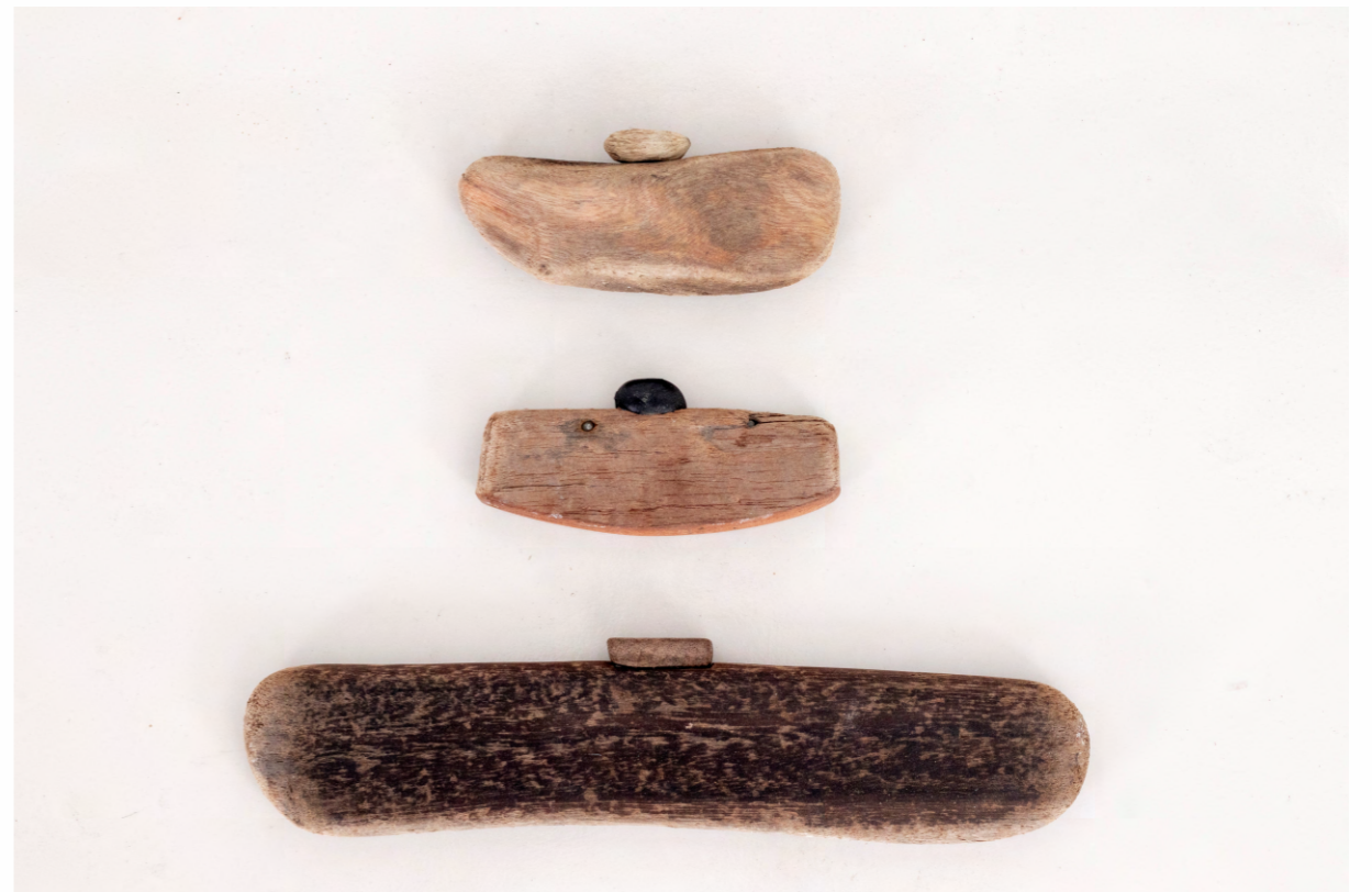
Construcción en madera proceso hombre murciélago