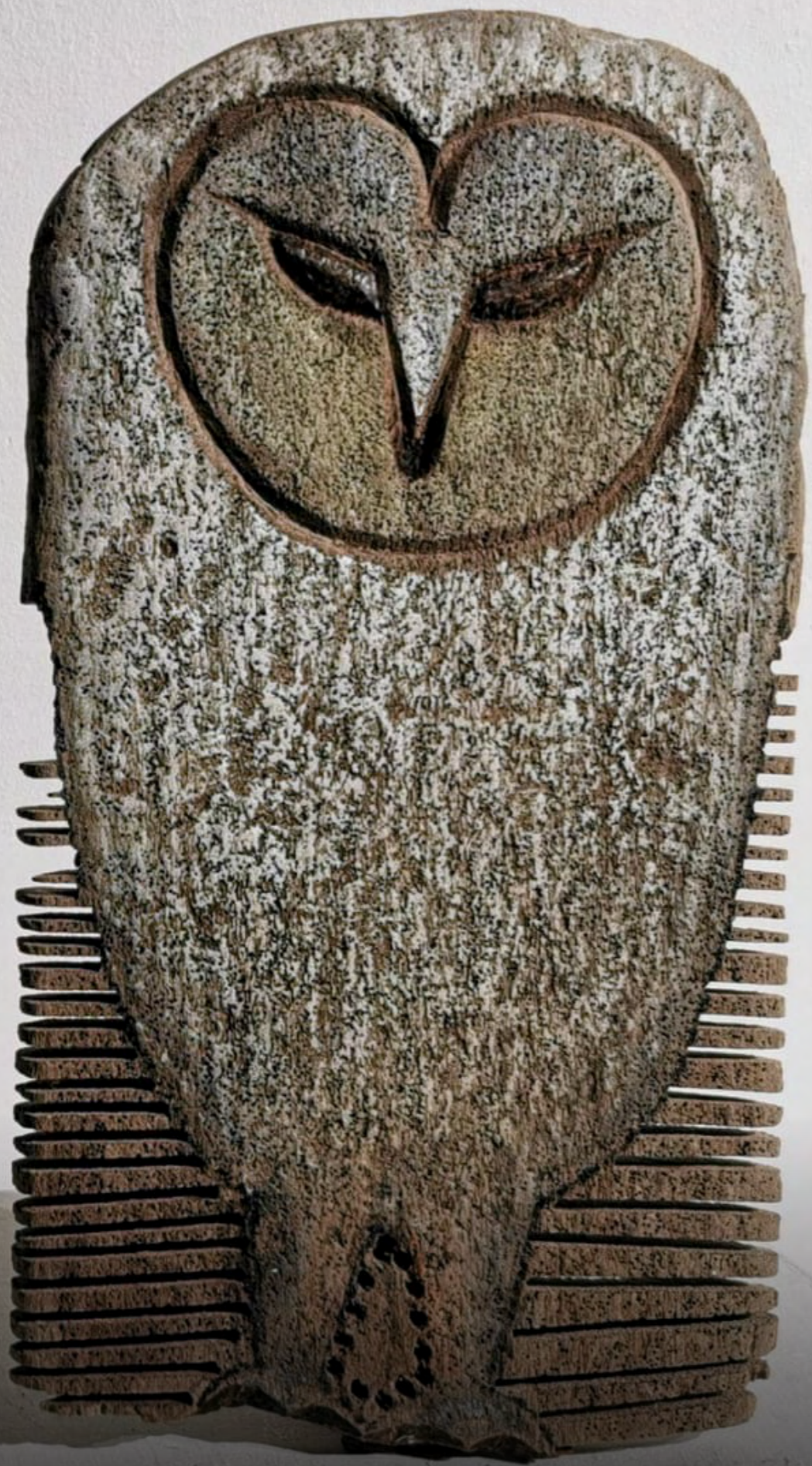
Búho, escultura en madera, 45 cms. X 35 cms