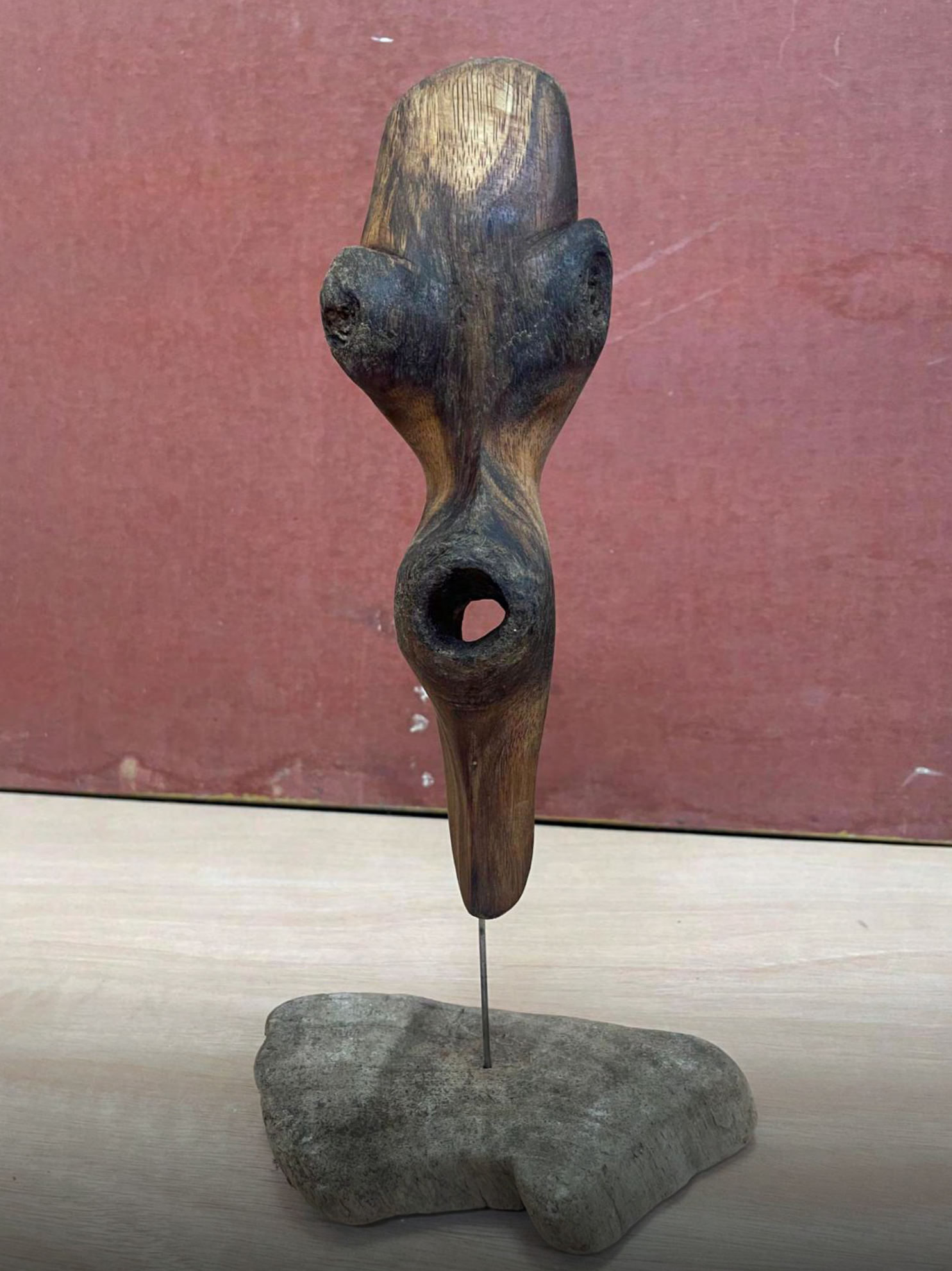
Sin título, Escultura en madera naufraga y metal, 35 cms. X 20 cms.