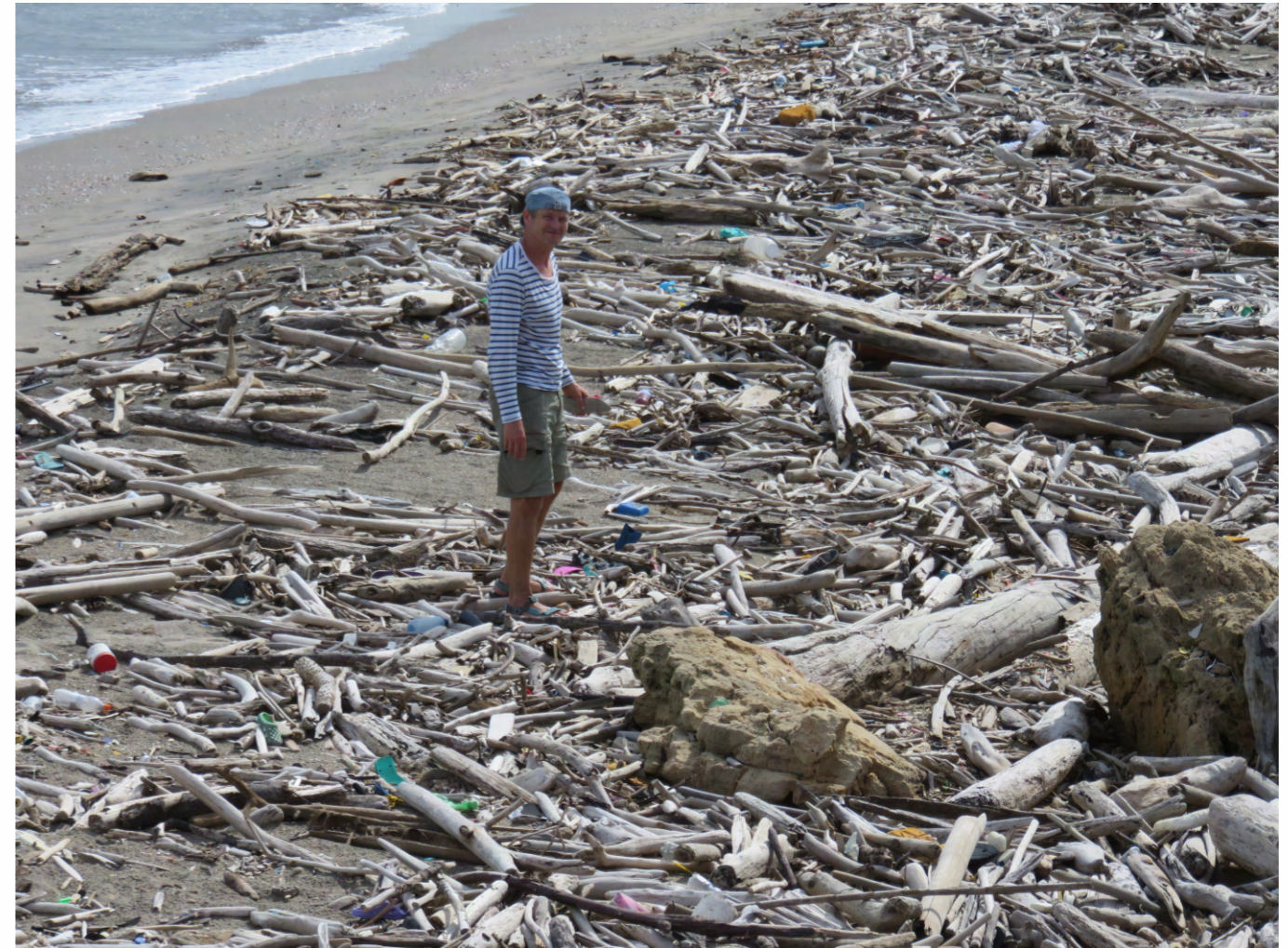
Playas de Puerto Colombia, Puerto Mocho,

Madera náufraga Ya pagó su viaje Cementerio De huesos puros Árbol fracasado, fragmentado De belleza esencial Reducido al imprescindible ¡No más preguntas! Respuestas finales Acumulación de llegadas Apuesta solución De tanto bailar y chocar Nutriendo hogueras y fantasías De vagabundos Los lleva A soñar