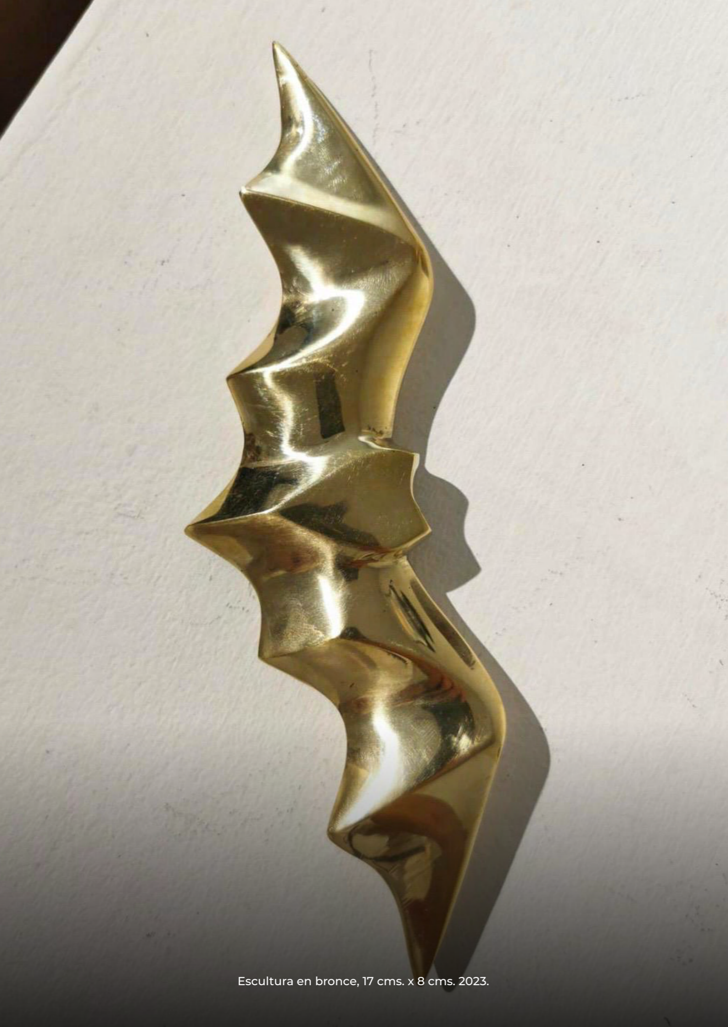
Escultura en bronce, 17 cms. x 8 cms. 2023.