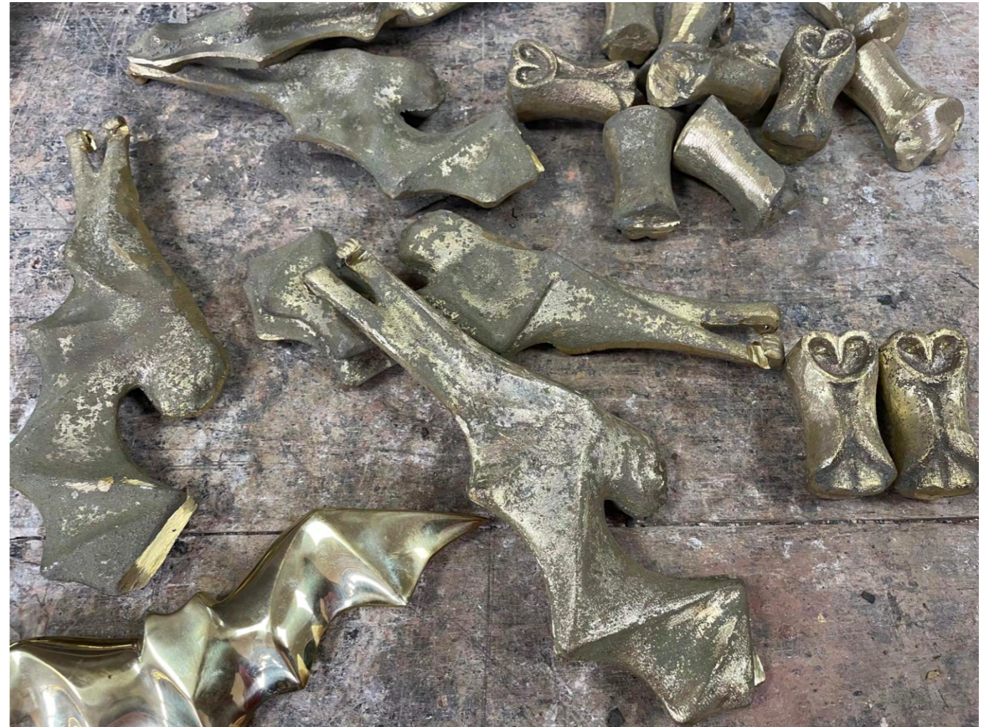
Proceso de fundición de esculturas en bronce