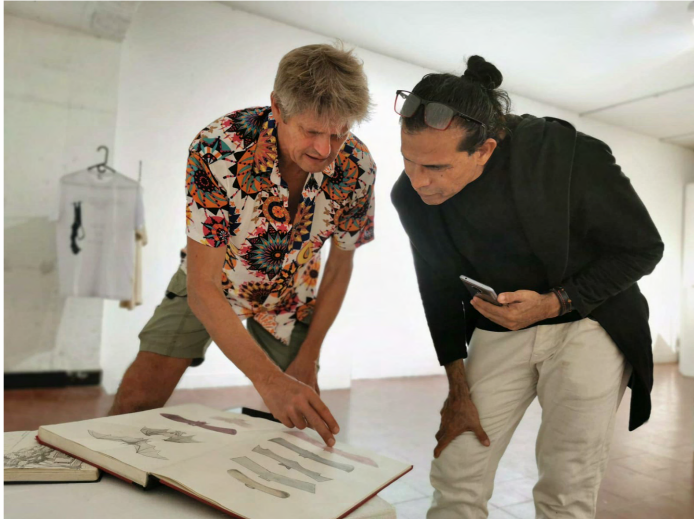
Exposición sala de proyectos Universidad del Atlántico, Barranquilla.