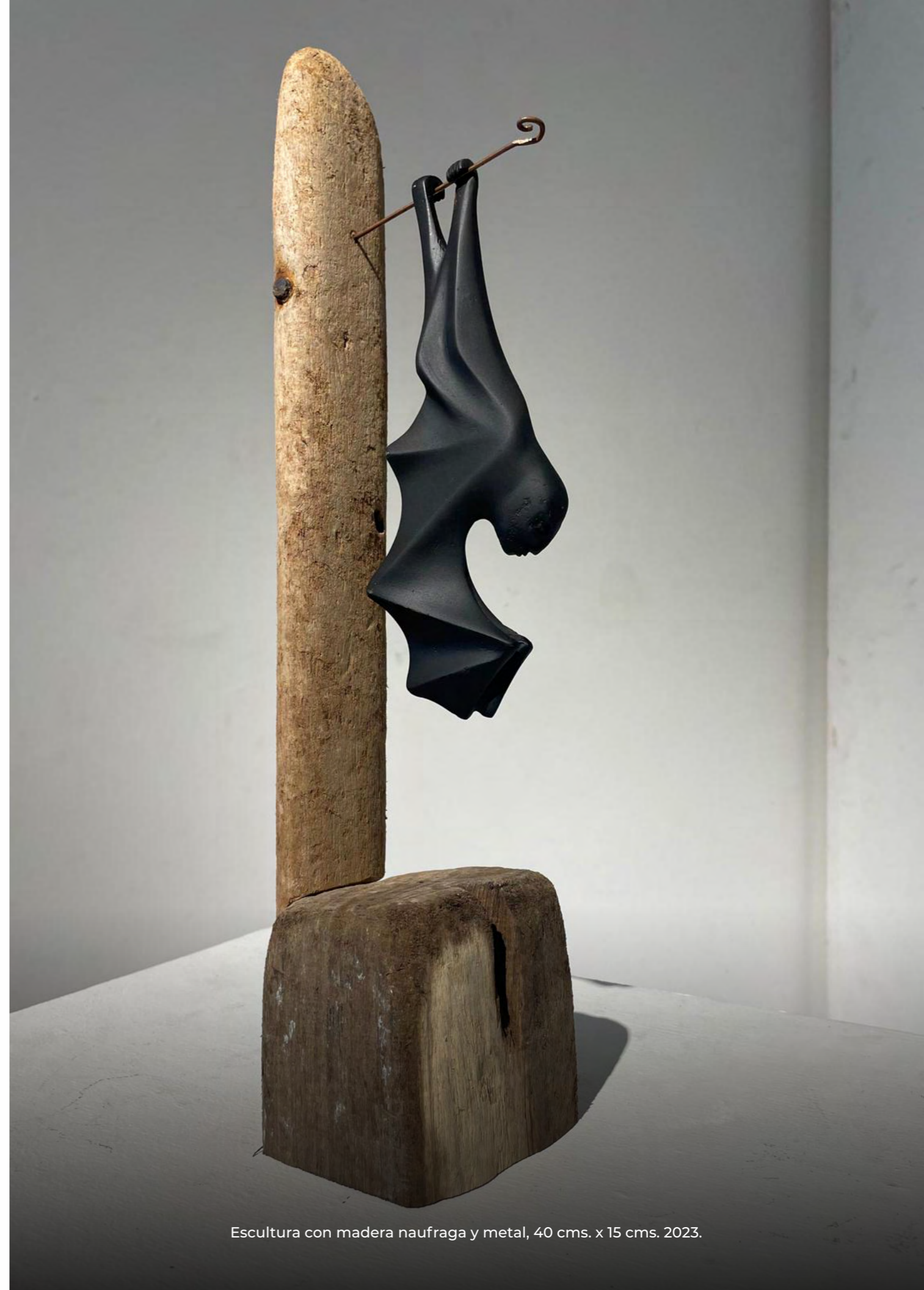
Escultura con madera naufraga y metal, 40 cms. x 15 cms. 2023.

Cruzando lo negro Llegando a otro mundo Uniéndolo en la oscuridad Náufrago Murciélago sin náufrago Pasando límites Desenfrenados Llegando al más allá viaje sereno Viaja a la raíz Vuela a fondo Hombre murciélago Hombrelago, chamán Hombre caimán, sin fronteras De viajes radicales Chofer y capitán Capitán murciélago Capitán Eco Traspasar estrechos oscuros Para hallar la luz del otro lado Con lucidez