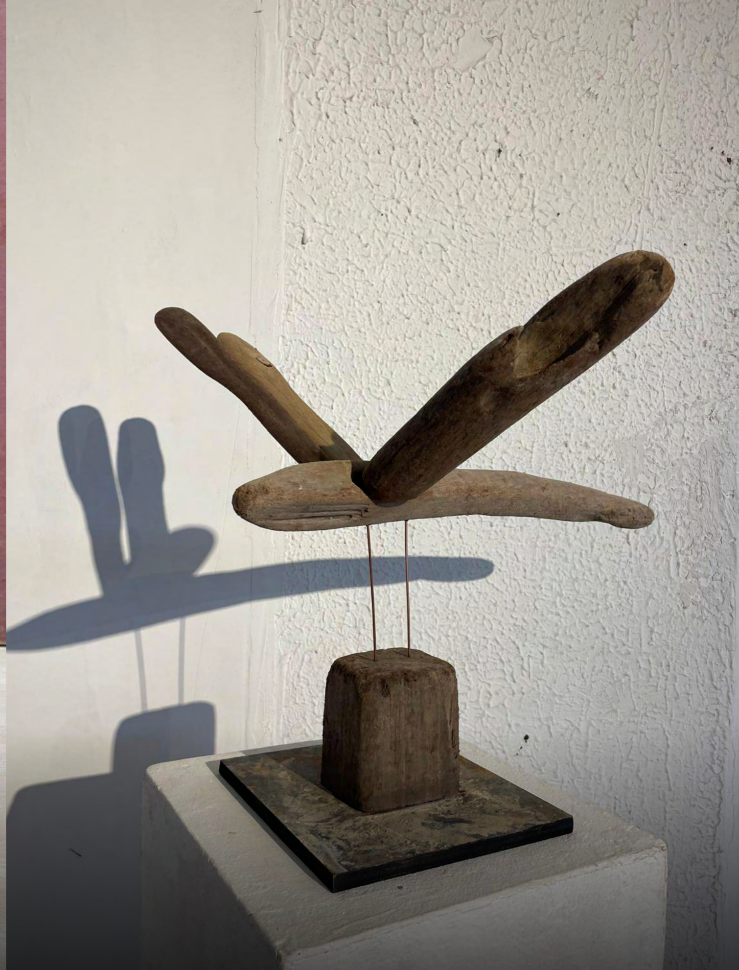
Volar, escultura ensamblada en madera naufraga y metal, medidas variables, 2023